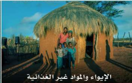
الإيواء والمواد غير الغذائية