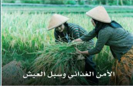
الأمن الغذائي وسبل العيش